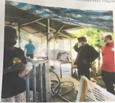
รูปถ่ายการตรวจสอบข้อเท็จจริง กรณีเหตุเดือดร้อนว่าพายุเฮอร์ริเคนพัดถล่ม